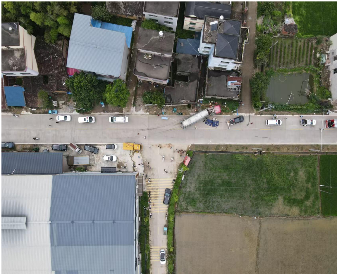
图一：事故现场航拍图